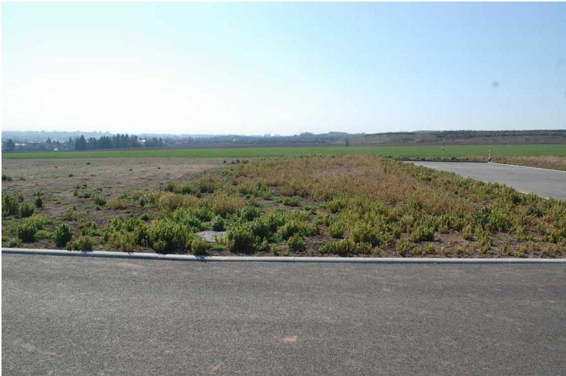
příjezdová komunikace - okolí